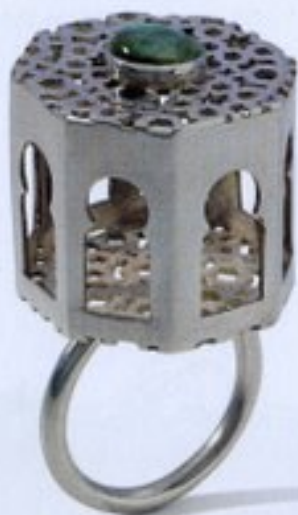
Diwan, anel Prata e labradorite 3,5 x 4 cm | 2010

anacaldas3@yahoo.com www.anamoraiscaldas.com